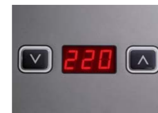
Централизованный температурный контроль