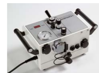
Все соединения на задней панели гидравлического блока